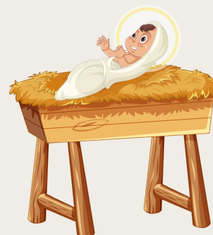
Ježíš uložený v jeslích