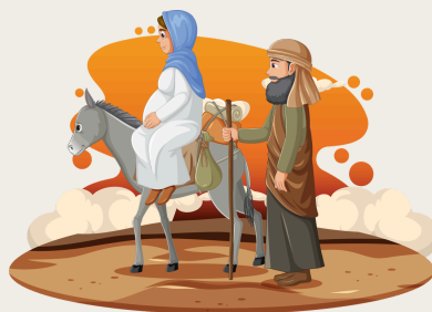
Marie a Josef na cestě do Betléma